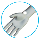
우측 손목(안 측면)