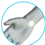
우측 손목(안 측면)