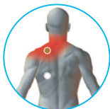
그림 1.3 좌측 등(후면)