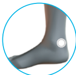
우측 발목(안 측면)