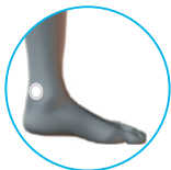
좌측 발목(안 측면)