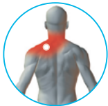
그림 1.6 좌측 어깨 (후면)