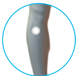
우측 무릎 아래(정면)