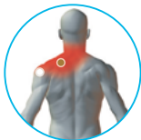
그림 1.4 좌측 승모 (후면)