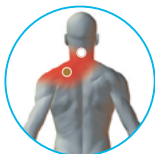
그림 1.1 목 (후면)