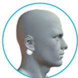
오른쪽 귀 아래(측면)