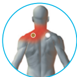
그림 1.2 우측 승모 (후면)